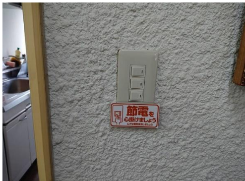
電気① 未使用時の消灯の呼びかけ