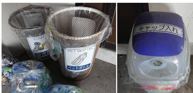
一般廃棄物④ ゴミの分別(PB・アルミ缶)