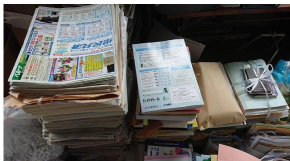
一般廃棄物④ ゴミの分別(古紙)