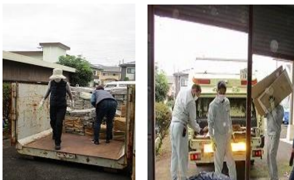
一般廃棄物④ 機密文書等の回収