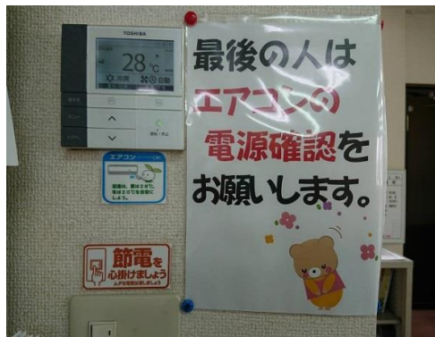
電気② 空調温度管理