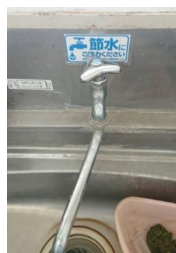
水使用量削減① 節水の呼びかけ