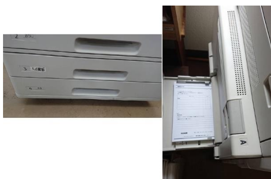
一般廃棄物③ 裏紙利用