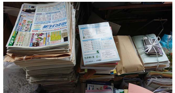
一般廃棄物④ ゴミの分別(古紙)