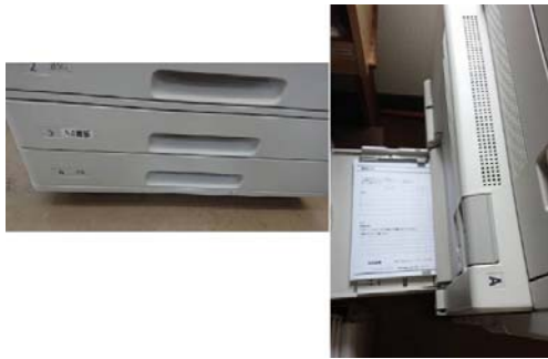
一般廃棄物③ 裏紙利用