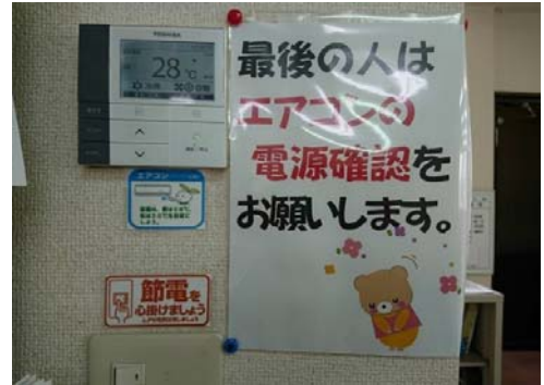
電気② 空調温度管理