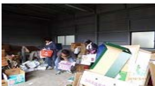
一般廃棄物④ 機密文書等の回収