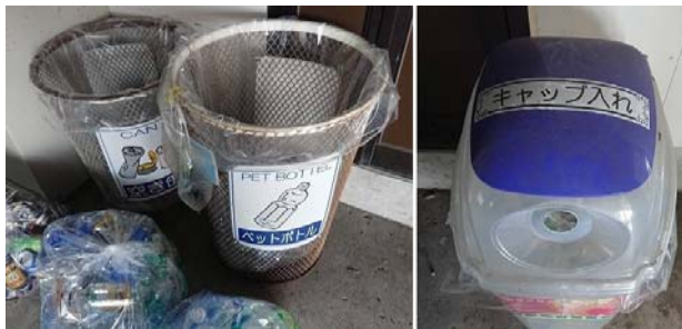
一般廃棄物④ ゴミの分別(PB・アルミ缶)