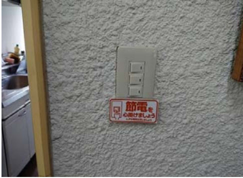
電気① 未使用時の消灯の呼びかけ