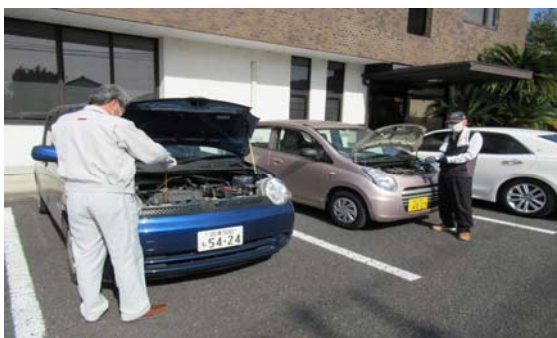
緊急対応訓練 車両点検