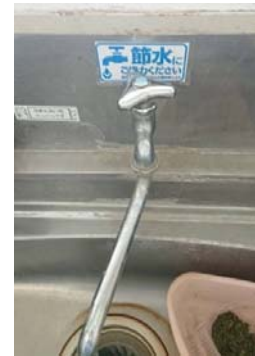
水使用量削減① 節水の呼びかけ